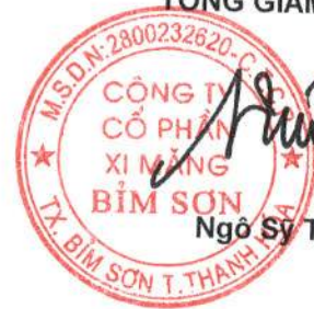
Ngô Sỹ Túc