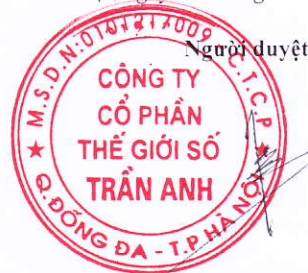
Trần Xuân Kiên