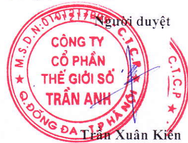
Trần Xuân Kiên