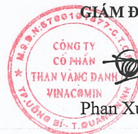
Phan Xuân Thủy