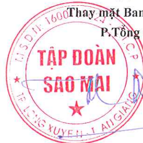
TRƯƠNG VĨNH THÀNH