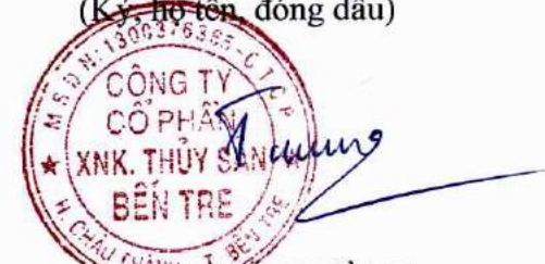
ĐẶNG KIẾT TƯỜNG