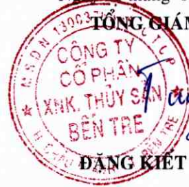
ĐẶNG KIẾT TƯỜNG