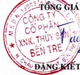
ĐANG KIẾT TƯỜNG