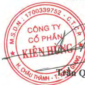
Trần Quốc Dũng