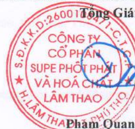
Phạm Quang Tuyền

(Các thuyết minh từ trang 10 đến trang 36 là bộ phận hợp thành của Báo cáo tài chính tổng hợp này)