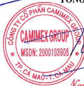
Nguyễn An Ninh