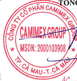
Nguyễn An Ninh