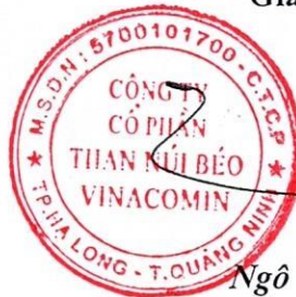
Ngô Thế Phiệt