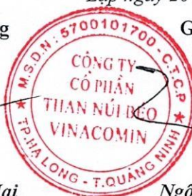
Ngô Thế Phiệt