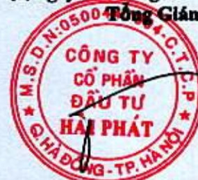
Đoàn Hòa Thuận