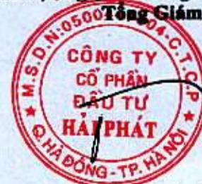
Đoàn Hòa Thuận