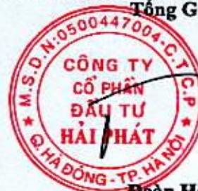
Đoàn Hòa Thuận